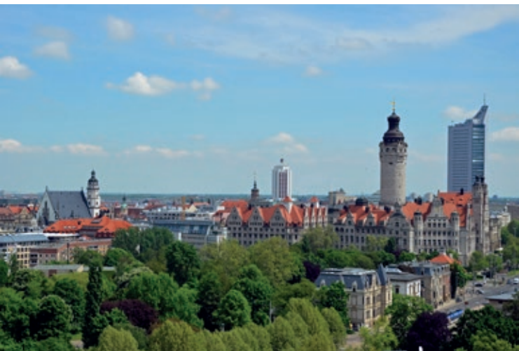
Skyline von Leipzig.